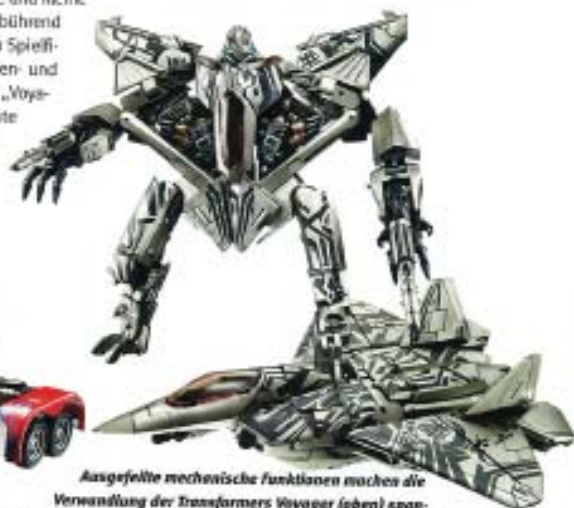
Ausgefeilte mechanische Funktionen machen die Verwandlung der Transformers Voyager (oben) spannend. Rechts: Der Optimus Prime ist der Star im Leader Sortiment