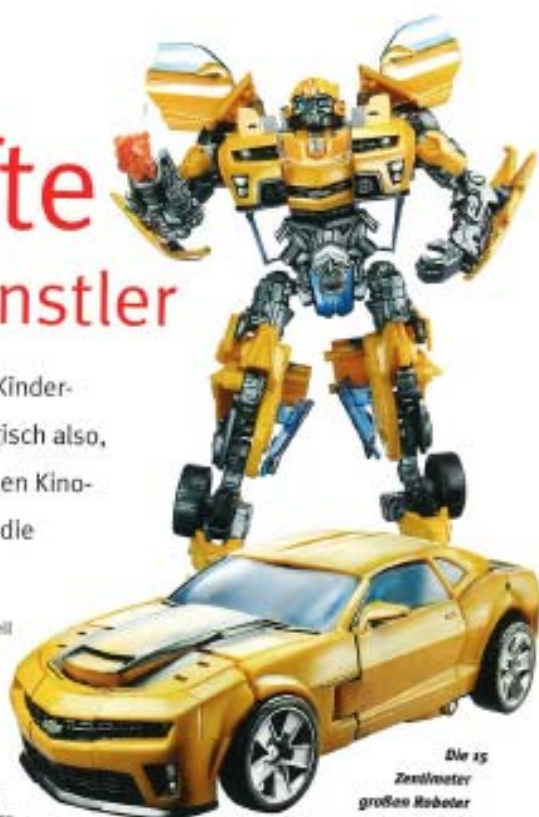
Die 15 Zentimeter großen Roboter aus dem Deluxe Sortiment verfügen über viele Details

24,3 Prozent Marktanteil das dominierende Thema des Boys Toys-Segments. So ist der Ausblick auf 2009 auch vielversprechend, zumal „Transformers Animated“, die TV-Serie, seit 7. März wieder auf Super RTL läuft. Zusätzliche Unterstützung zum Kinofilm erhalten die sich verwandelnden Helden und Bösewichte durch TVSpots bis in den Herbst/Winter. Eine Burger King Kids Menü-Promotion rechtzeitig zum Filmstart und ein Panini Sticker-Album ist in Planung. Es wurde also dafür gesorgt, die Transformers Actionfiguren für große und kleine Fans der Fahrzeug-Roboter gebührend in Szene zu setzen. Neben den Spielfiguren in den bewährten Größen- und Preissegmenten der „Deluxe“, „Voyager“ und „Leader“ Sortimente stehen für 2009 auch wieder altersgerechte Figuren und Fahrzeuge für jüngere Transformers-Fans auf dem Plan.